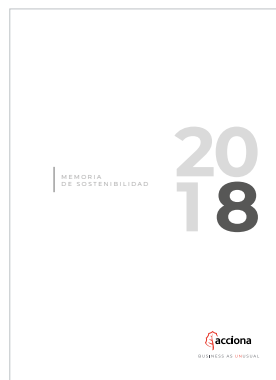
Memoria de Sostenibilidad