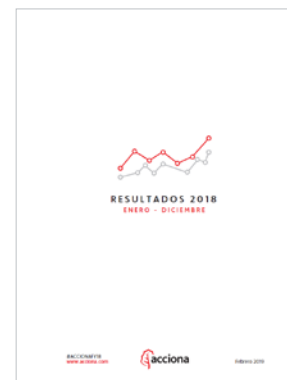
Presentación de Resultados